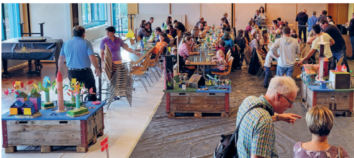
Kindertage auf dem Haldenbüel, September 2023

Unsere Mitarbeitenden haben den Jugendlichen und Jungen Erwachsenen mit den Sommerlagern, dem Konflager und refresh camp Plattformen ermöglicht, wo die Gemeinschaft und das Glaubensleben gestärkt worden sind. Eine Leiterin erwähnte in einem