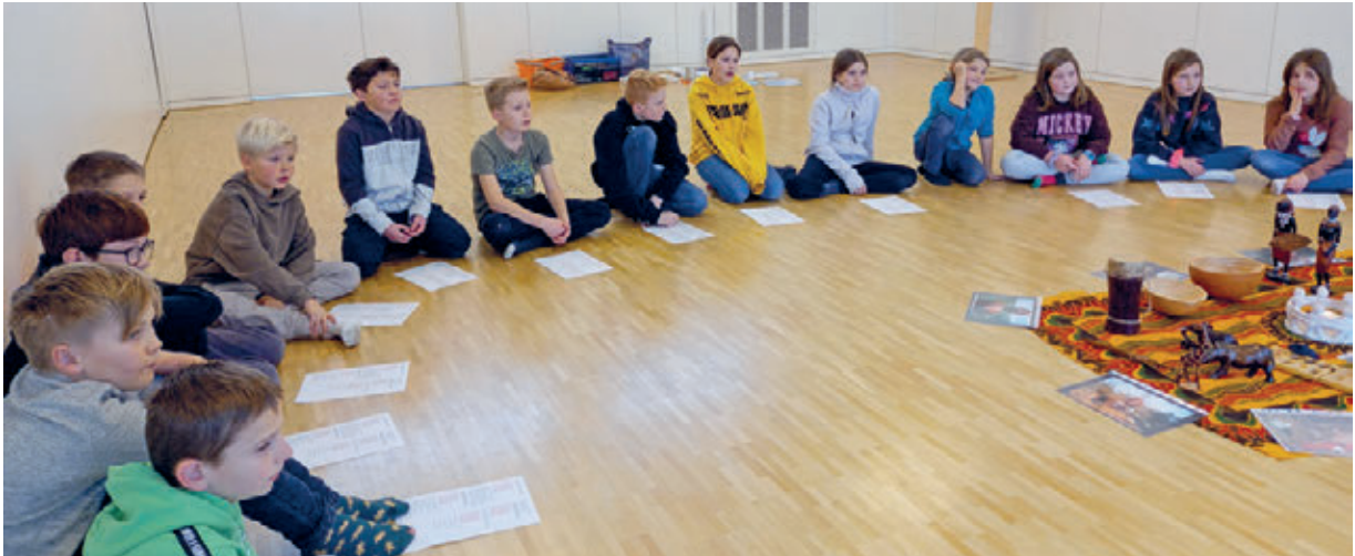
Kinder helfen Kindern – Projekt in Andwil

Interview, dass eine Woche Lager für die Beziehungen untereinander so viel bringt, wie ein ganzes Jahr Jugendarbeit. Ein starker Fokus wird auch in Zukunft auf ein vielseitiges Lagerangebot gesetzt.