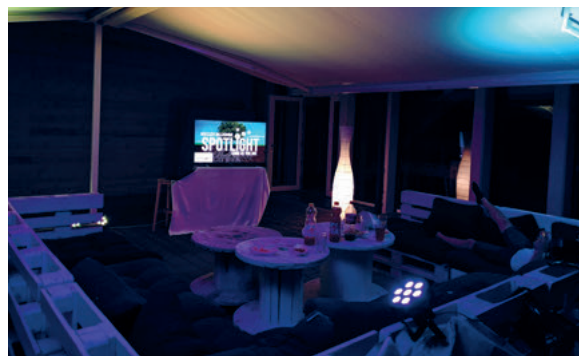
Spotlight ab 16 Jahren

junge Erwachsenen-Arbeit sehr gut. In der Jugendsprache steht das Wort stabil nicht zwingend für die Stabilität eines Bauwerkes, sondern bedeutet vielmehr so viel wie cool, ordentlich und super! Und genau das war unser 2023. Mit 68 auf Pfefferstern ausgeschrieben und durchgeführten Erlebnis-