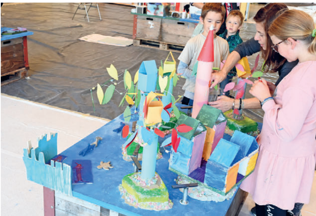
Kindertage auf dem Haldenbüel

Als Ressortleiter hatte ich mit der aktiven Teilnahme an den Kindertagen im September auf dem Haldenbüel einen persönlichen Höhepunkt im kirchlichen Jahr erleben dürfen. Selten durfte ich solche Energie von Kindern so hautnah miterleben und habe die Gemeinschaft schätzen gelernt. Ganz generell bin ich im Amt gut angekommen.