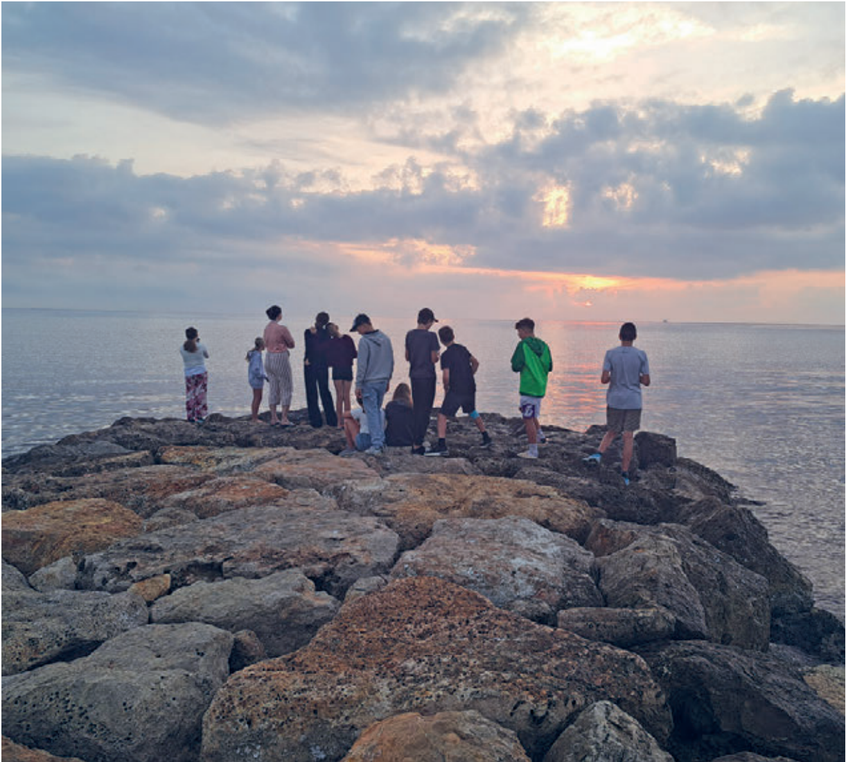
refresh camp in Spanien im Oktober 2023

«Kultur&Bibel», «Family Time» sowie auch die «KraftBar» haben sich im 2023 weiterentwickelt. Ergänzend wollen wir mit den Gottesdienstfeiern im öffentlichen Spielplatz oder Ende August im Aussenbereich des Gemeinschaftshauses Witenwis noch näher bei den Menschen sein.