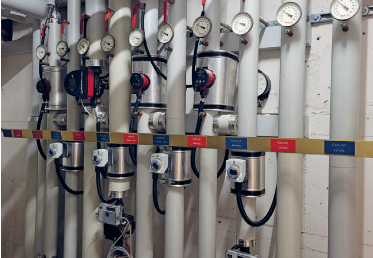
Abbild 2: Schnitzelheizung KGH