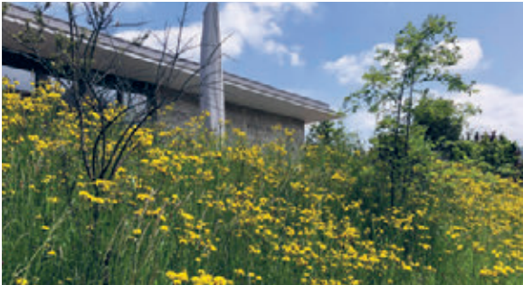
Die Wildblumen ums Haus entwickeln sich