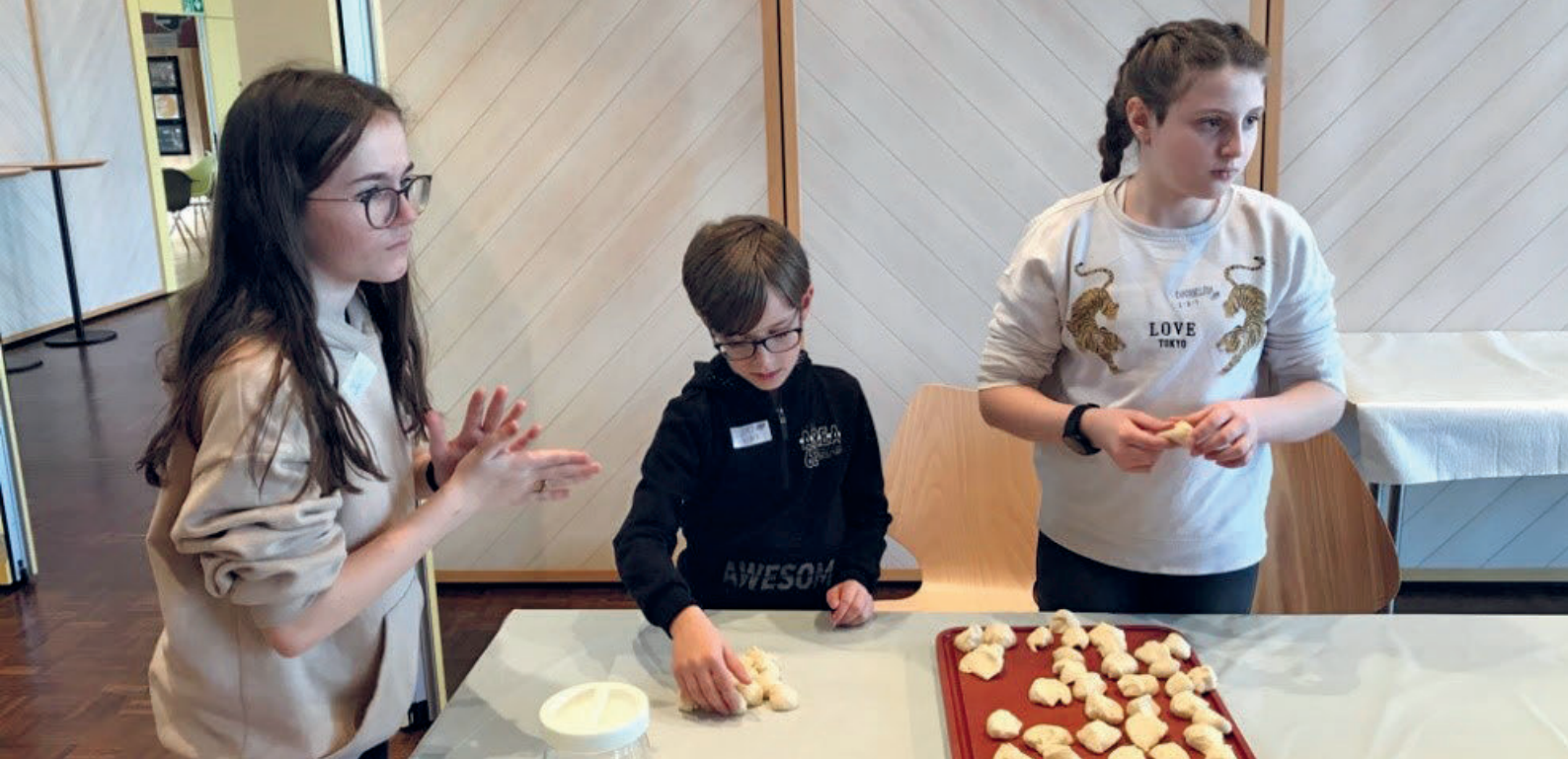
Brot für das Abendmahlprojekt selbst backen