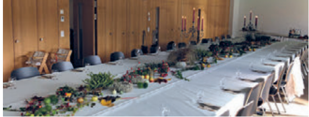
Schöne Tavolata im Saal