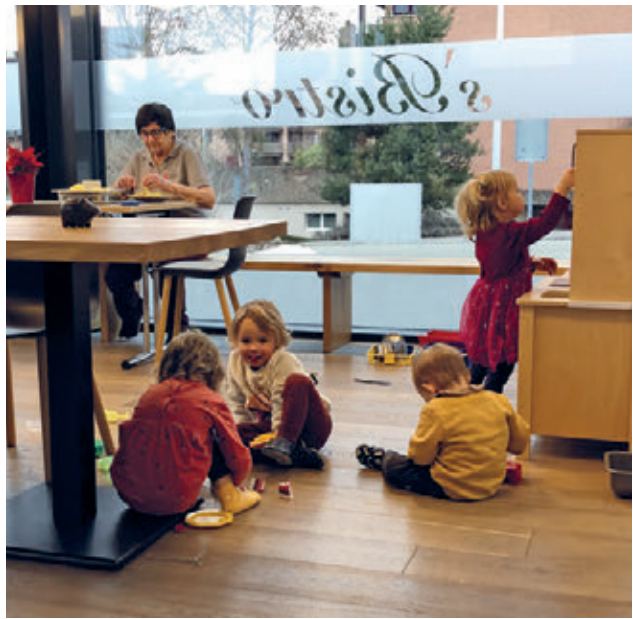
Generationenhaus: Kinder der «Klangwiese» spielen, und eine freiwillige HelferIn rüstet Gemüse