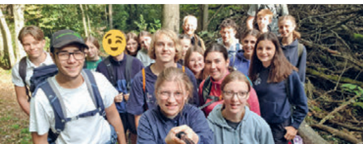
Konflager Magliaso TI