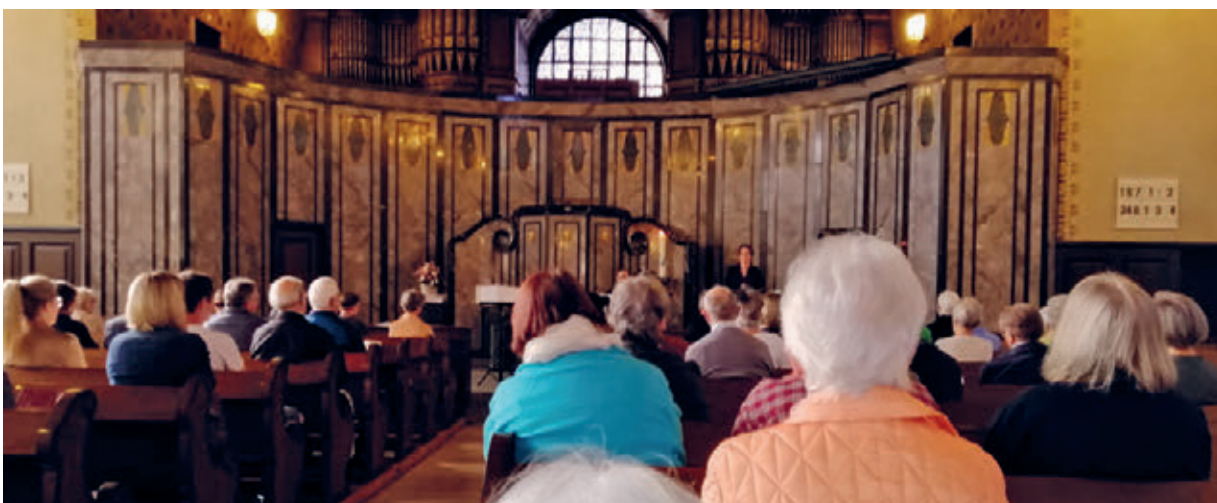
Gottesdienst in der Kirche Feld, Flawil

Weitere Details erhalten Sie zeitgerecht über unsere Website, per Flyer oder im Kirchenboten.