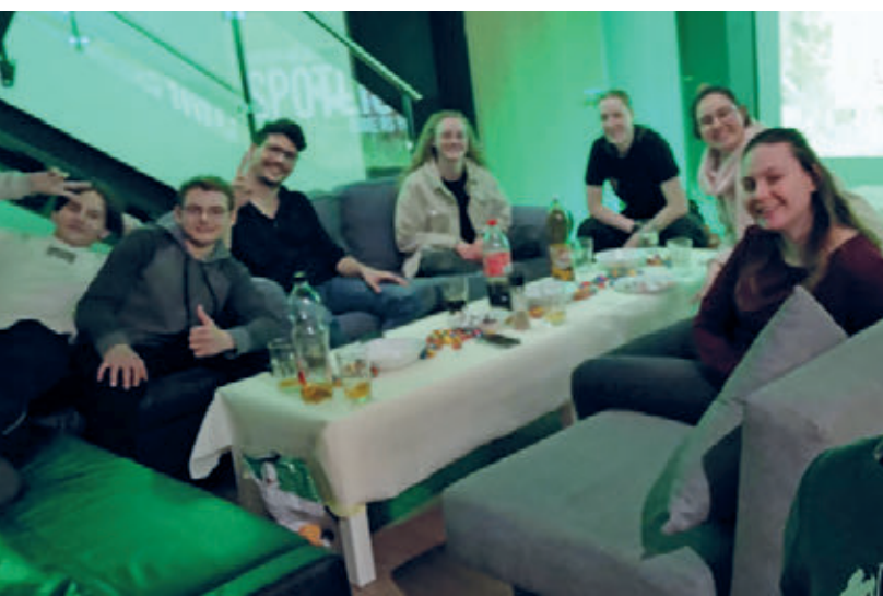
Spotlight ab 16 Jahren

programmen, vom gemeinsamen Besuch im Altersheim über den Seilparkbesuch mit und ohne Eltern, bis zum Volleyballturnier, war der Jugendarbeitskalender schon mal gut gefüllt. Die Besucherzahlen in unserem offenen Jugendtreff Westhouse waren zwar nicht ganz immer so stabil, dafür umso intensiver die Tischfußballspiele. «stabil Leischtig amene stabile Match ;-») Auch unsere Jugendtreffs «Blox», «Maitli-» und «Jungstreff», sowie die junge Erwachsenen Events «Spotlight», hatten zwischenzeitlich etwas instabile Besucherzahlen – dafür stabile Programme. Umso erfreulicher, dass ein stabiler Kern an engagierten Jugendlichen und jungen Erwachsenen jedes Mal dabei ist. Die übers Jahr stattfindenden Events des Konfweg 7–9 bilden für unsere jungen Kirchbürger:innen die stabile kirchliche Bildungsbasis. Wenn wir daran denken, dass wir auch in 20 oder 30 Jahren eine stabile Basis in Form von Kirchbürgerinnen und Kirchbürgern benötigen, dann investieren wir hier genau an der richtigen Stelle.