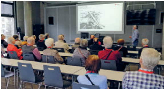
Führung Empa St. Gallen