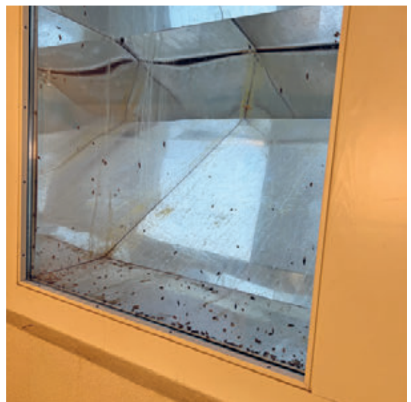
Abbild 2: Heliobus, Treppenabgang ins UG