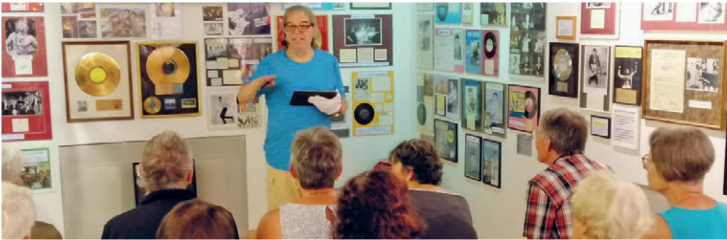
Führung Rock- & Pop Museum Niederbüren