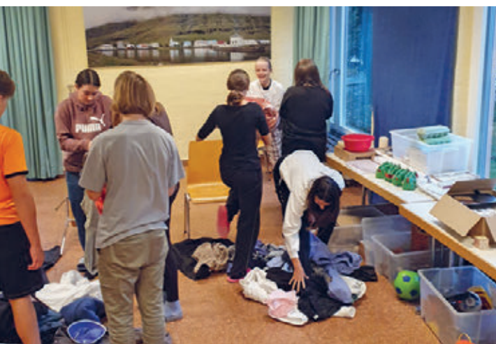
Konflager Magliaso TI

Über das Jahr verteilt nehmen die «Könfis» an verschiedenen Events, Erlebnisprogrammen und Konfabenden teil.