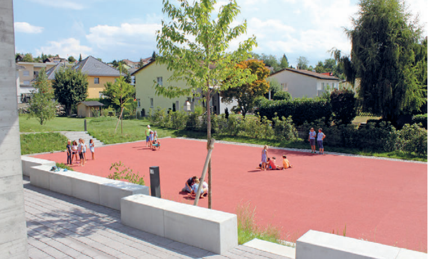
Roter Platz beim Gemeinschaftshaus Witenwis

Ebenfalls bleiben uns die Gespräche im s'Bistro zwischen Tür und Angel haften. Auch dort durften wir Berührendes, Nachdenkliches und Humorvolles erleben.