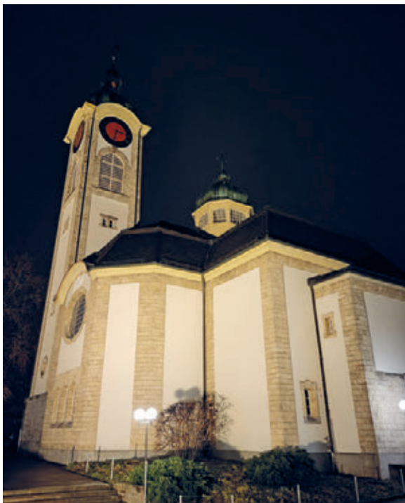
Abbild 1: stolze Kirche der Adventszeit

Diese Investitionen betragen CHF 24'387.50, welche im vollen Umfang in die Verwaltungsrechnung 2023 eingeflossen sind.