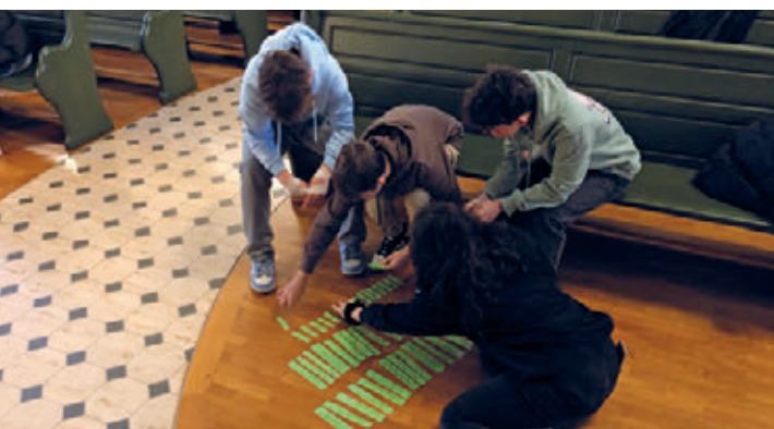
Konfhalbtag in der Kirche