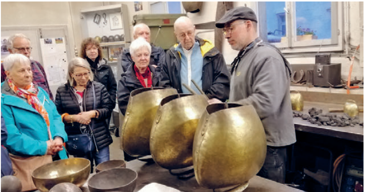
Besuch bei der Schellenschmiede Marstal

Es war und ist immer wieder grossartig zu spüren mit welcher Begeisterung und Herzblut die jeweiligen Referenten und Zuständigen, ihre Arbeit, ihre Betriebe oder Museen präsentieren.