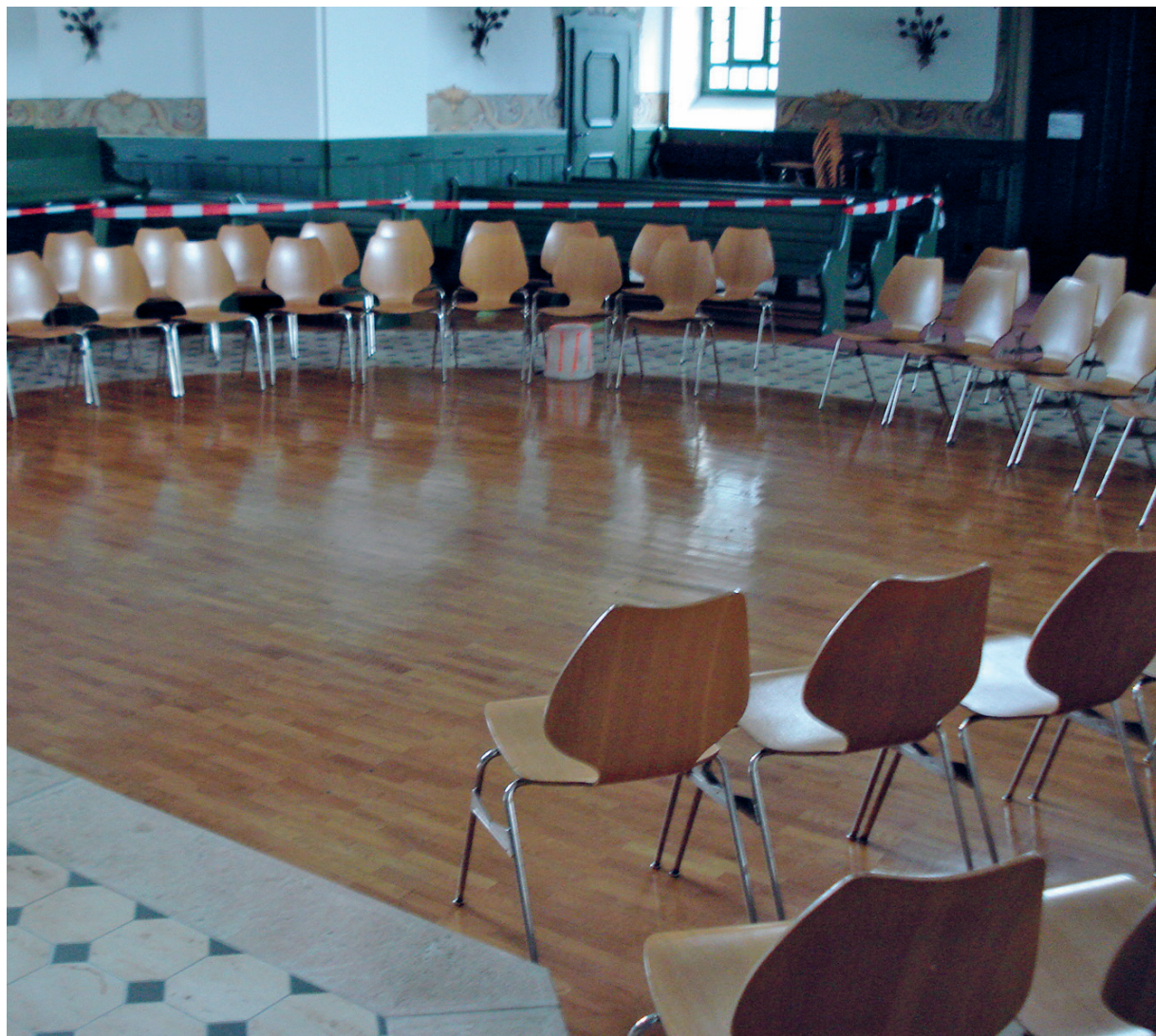
Abbild 3: Aufnahme Mitte 90er Jahre, Malen