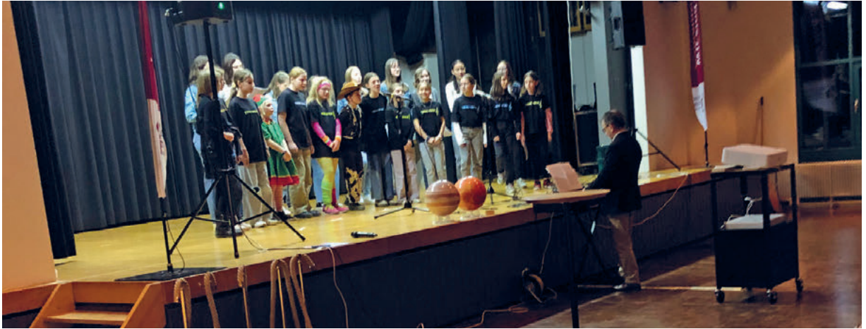
Auftritt YoungVoices und BlueJeans Kinder-/Jugendchor am Dankeschönanlass 2024