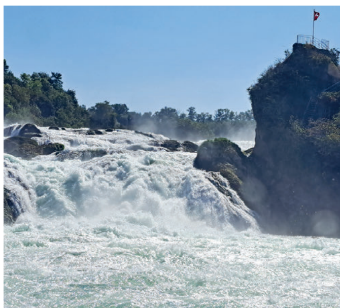
Auf dem Rhein