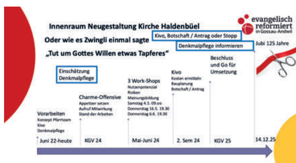
Abbild 5; Prozessdarstellung KGV 2024

nisse wie Taufe, Hochzeit, Konfirmation oder Abdankungen. Ein Ort, der gute bleibende tiefe Erlebnisse schafft.