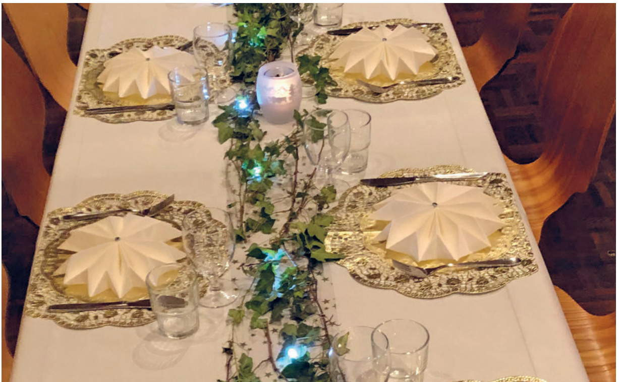
Tischdekoration am Dankeschönanlass 2024

Liebe Lina, herzlichen Dank für deinen wertvollen Rückblick.