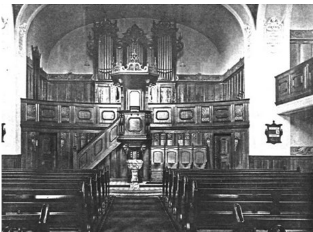
Abbild 1: Aufnahme Februar 1914