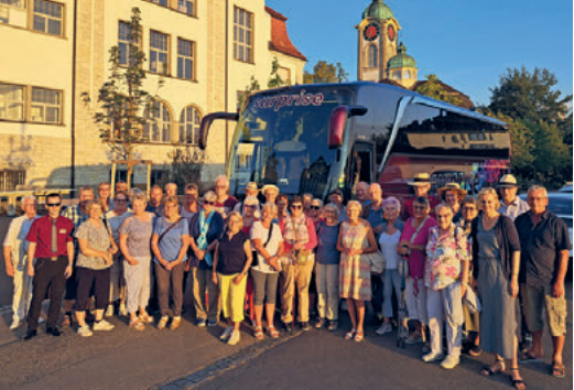
Rückkehr Reisebus Tagesausflug