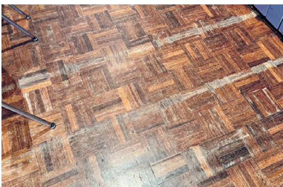
Abbild 1: defekter, abgenutzter Parkett

Die nachfolgende Darstellung zeigt den Stand der Umsetzung sowie die kostenmässige Bauabrechnung.