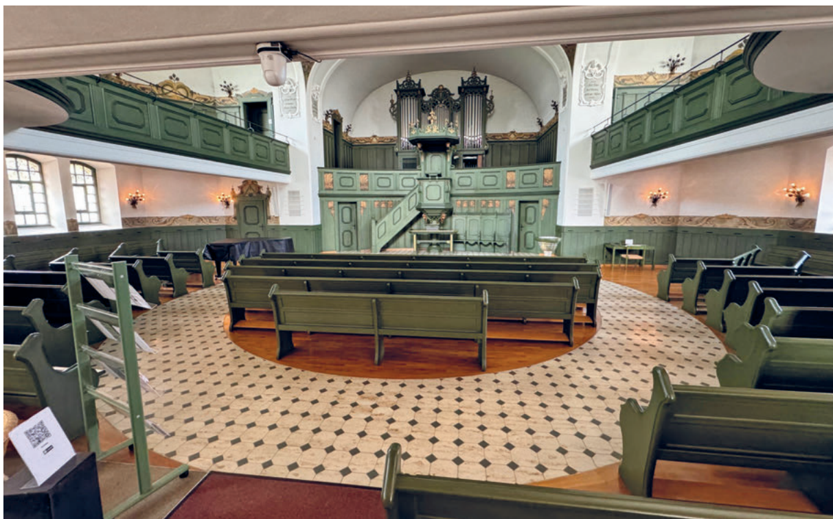
Abbild 4: Aufnahme heute