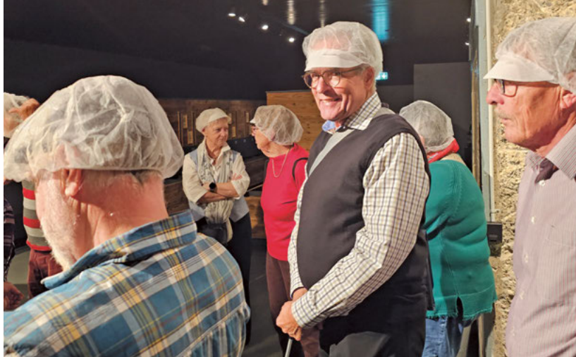
Führung Appenzeller Alpenbitter

Vor der Rückreise trafen wir uns noch in der gemütlichen Stube der Bäckerei drei Könige zum feinen Vesperplättli.